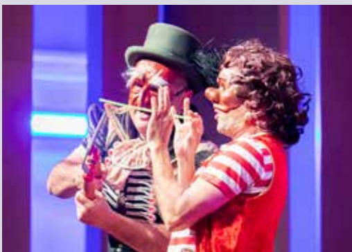
מתוך התכנית "התזמורת מארחת את הקרקס של פנטלון"