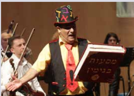
מתוך "מסע מוסיקלי בעקבות בנימין מטודלה"