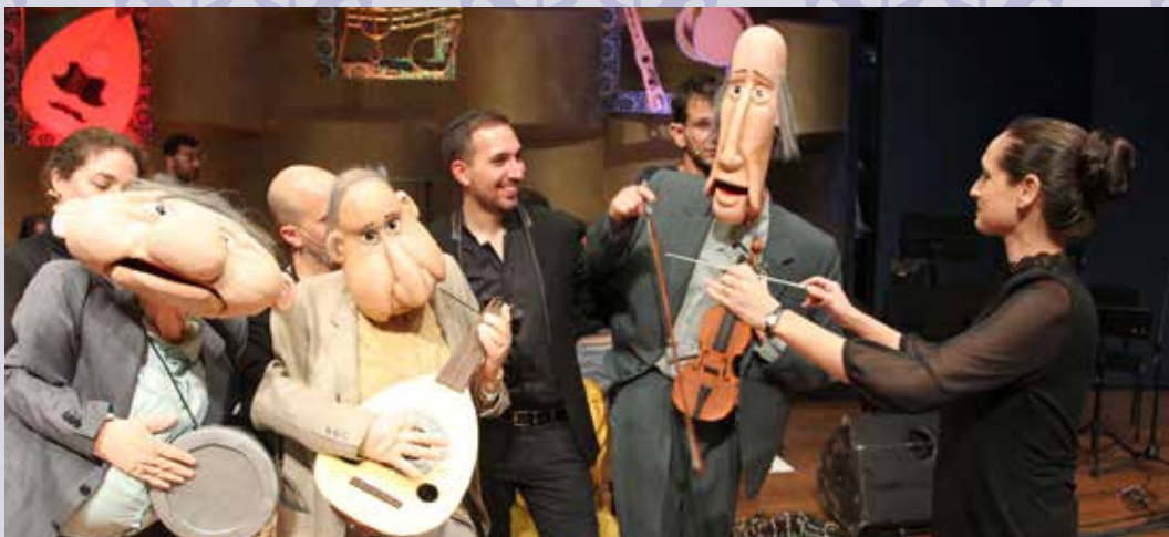
מתוך "בובה של תזמורת"